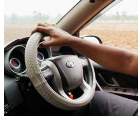
Tekst & foto's Saskia Konniger